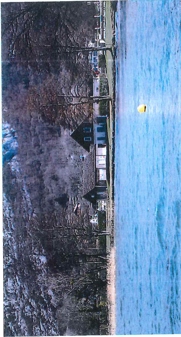
PC8 - Photo 6 : Le bâtiment actuel de la Petite Fringale et la Villa Honoré vue depuis le Lac

Nota : Les prises de vues photographiques sont repérées sur le plan de situation PC1.