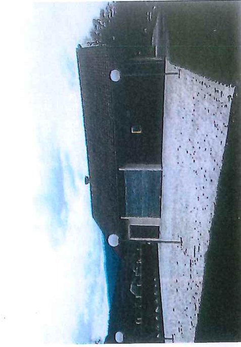
PC7 - Photo 5 La Petite Fringale, côté Est (en hiver)

Couvrage: Réaménagement de la plage de Duingt Allée de la plage - 74410 DUJINGT