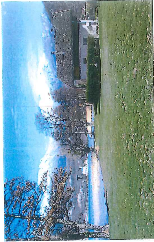
PC8 - Photo 7 : Vue vers l'Est : le Château Ruffy, La Tournette et la Villa Honoré au premier plan