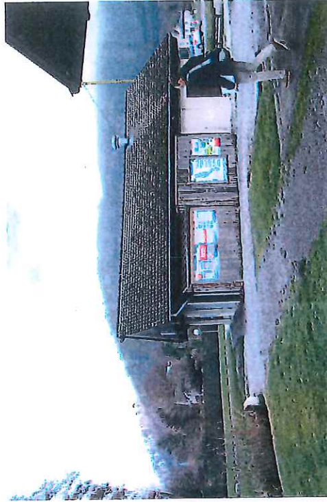
PC7 - Photo 4 La Petite Fringale, côté Ouest