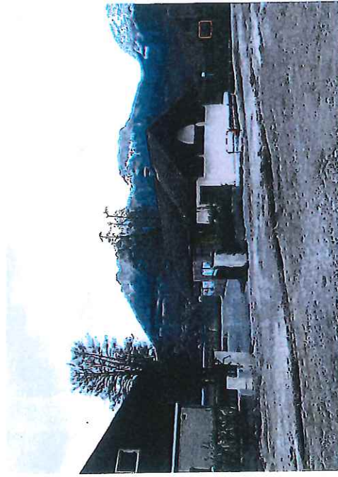
PC7 - Photo 3 La Petite Fringale, depuis la Route Départementale