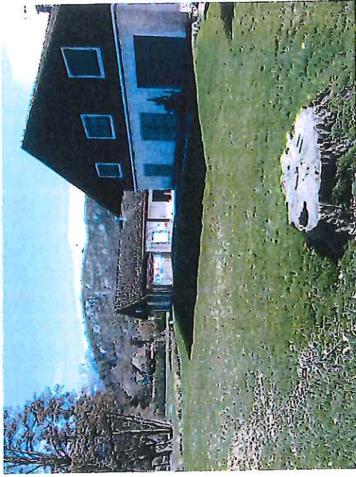
PC7 - Photo 1 Vue côté Lac

Nota : Les prises de vues photographiques sont repérées sur le plan de situation PC1.