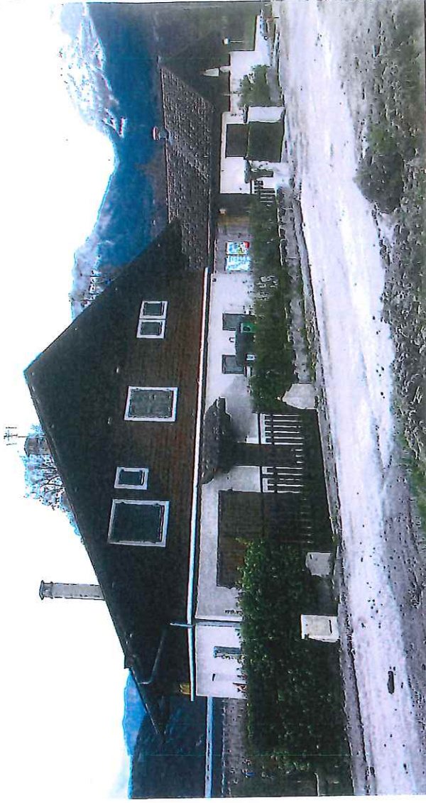
PC7 - Photo 2 La Villa Honoré, depuis la Route Départementale