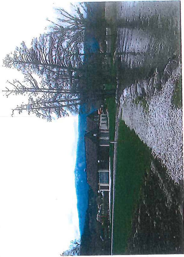
PC8 - Photo 8 : Vue depuis l'extrémité Est de la plage