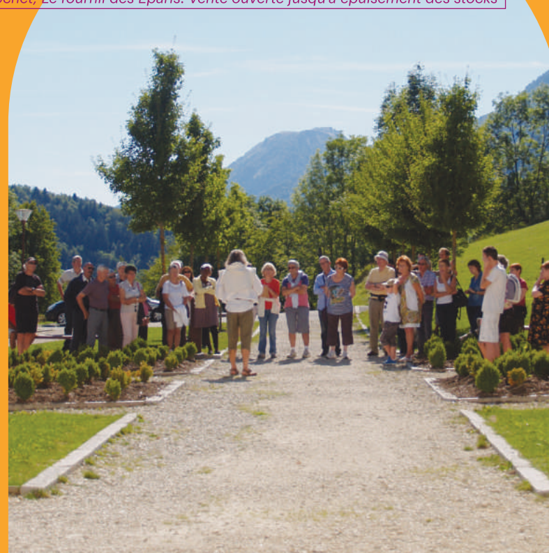
Visite guidée à la Chartreuse d'Aillon